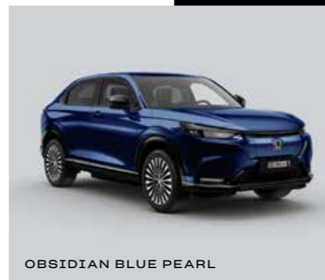
OBSIDIAN BLUE PEARL