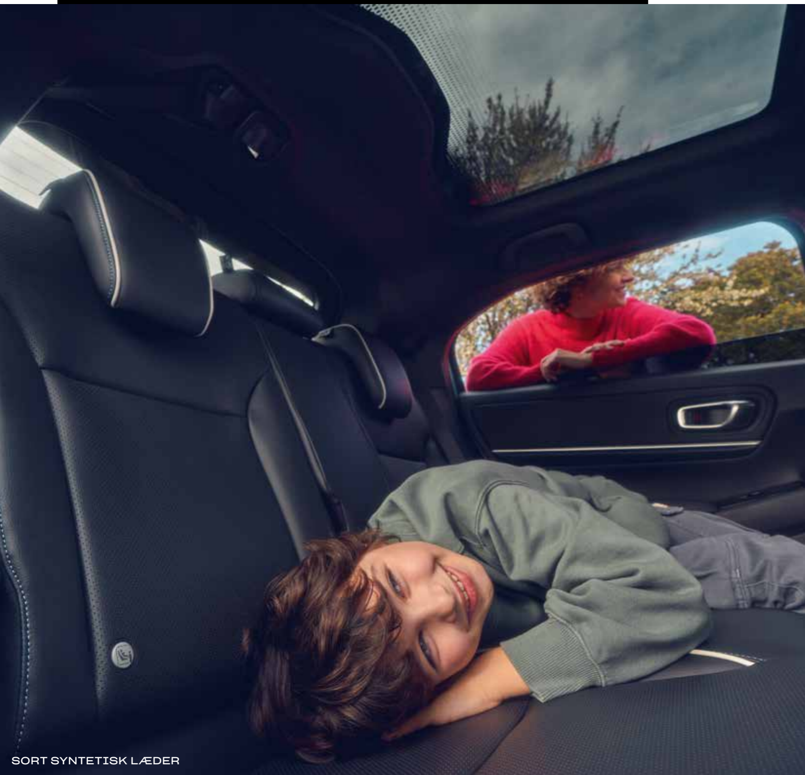
SORT SYNTETISK LÆDER

*Select grades and paint colours only. Den viste bil er Honda e:Ny! Advance i Aqua Topaz Metallic. Se specifikationerne på side 52-55 for at få flere oplysninger om, hvilket udstyrsniveau denne og andre funktioner findes på.